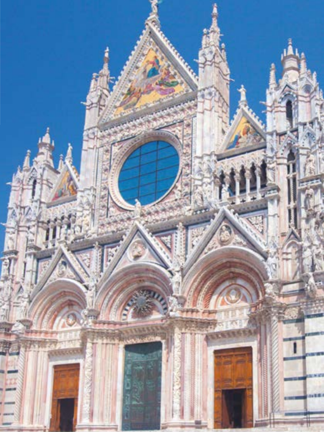
CATEDRAL DE SIENA, ITALIA