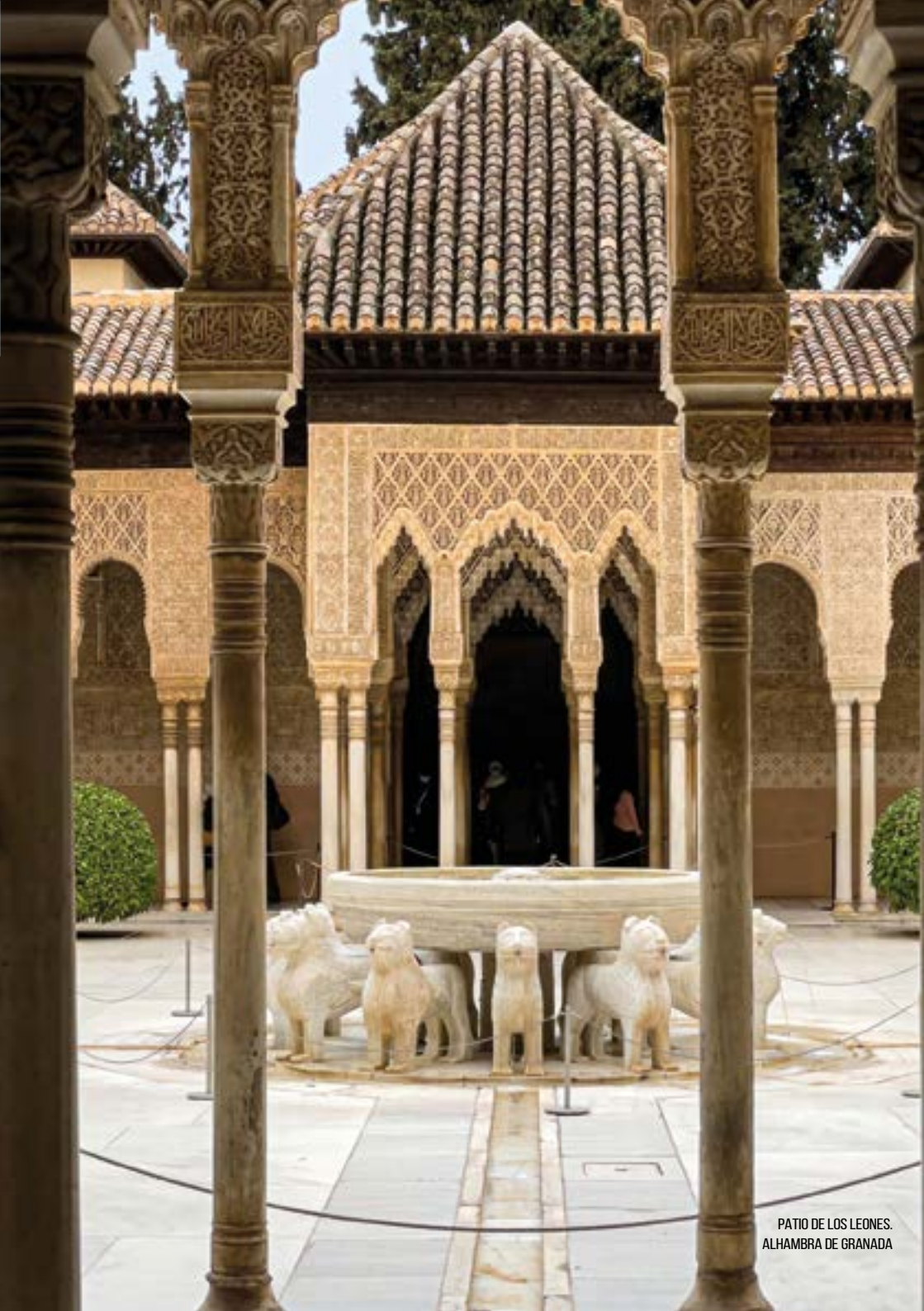
PATIO DE LOS LEONES. ALHAMBRA DE GRANADA