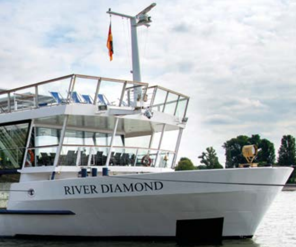
MS River Diamond